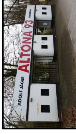
Eingangsportal der Adolf-Jäger-Kampfbahn